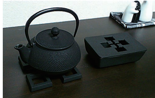
左・南部鉄瓶 右・南部鉄器の灰皿

先日、岩手県の世界遺産・平泉を訪れた際に、とある土産物屋に寄りました。それが私と南部鉄器の衝撃的な出会いでした。