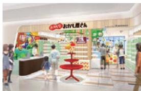
▲森永のおかしなおかし屋さん