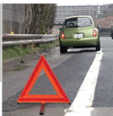
三角表示板は、脚を出して倒れないように。