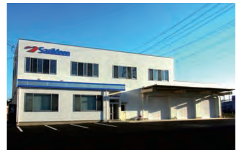
▲2011年10月竣工の本社新社屋