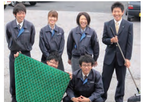
▲明るく元気な社員さん