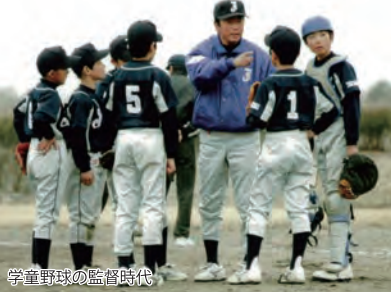
学童野球の監督時代

会社経営は経営計画を策定し経営目標、数値目標、経営戦略を遂行する能力や知識が必要である。前述のことを実行していくとき、同時に経営者に精神的な強さが要求されます。私は子供の頃から負けず嫌いでした。小学生から正式に始めた野球が性格に拍車をかけたことは確かです。こうして昔を振り返ると「会社経営の今につながる気持ちも、スポーツから多く学んだように感じます。」スポーツは身近でした。幼少期から野球に夢中でした。野球は個人競技と違って、チームワークが必要であり、また時には、相手に体当たりして弾き飛ばす、格闘技の要素もあります。相手チームが強いと思えば負け、守りの気持ちが生まれると、途端にチーム全体が崩れていくものです。逆に、自分達の強い印象を相手に与えられれば有利になり、気持ちもプレイもどんどん乗ってくる。だから試合開始前から、気合で相手を潰せ！という雰囲気があります。ゲームのトーンを決める、闘争のリズムをつくっていきます。そのために試合開始直前に、チーム全員で円陣「気合を入れていこう」と声をかけあつて士気を鼓舞するのです。人間って怖いと思つたら怖くなるし、死んでもいいからやるぞと思つたら死ぬ気でやるものです。ただ相手チームも同じことを考えていますから、それに打ち勝つメンタルの強さが必要とする。やられたら、やりかえす！勝負の鍵は、そういう気持ちだと思います。気持ちで負けないこと、絶対に勝つという信念を持ち続けること。その為にチームに必要なのは、常に共感しあえる分かりやすい目標を持つていることと、自信につながる理にかなった猛練習。これはアクティチャレンジの経営ビジョンにリンクするところがあります。「経営計画」「売上・利益の数値目標」「顧客満足度」「ISOを軸に展開している」「会社の品質」「社員の品質」「仕事の品質」それぞれに具体的な高い数値目標を設定し、全社員が目標達成を目指して頑張っています。