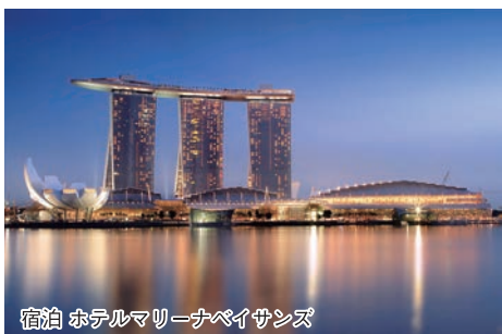
宿泊 ホテルマリナベイサンズ

成田発9:50で空路シンガポールへ約7時間の空の旅、チャンギ国際空港到着。 さすがベストエアポート賞を受賞している空港。規模が大きく全体的に明るくてお洒落な空港内。専用バスで夕食会場へ。感じたことは空港から都心部まで20分、30分で着けるので交通が整備されている事。気温日中は34度前後、夜は24度くらい蒸し暑いが室内はエアコンが結構効いているので上着があれば丁度よい。夕食先ジャンボシーフードで全員地ビールのタイガービールで乾杯。チョット酸味があつて気候風土にあつた美味しいビールでした。郷土料理を堪能しながら、ほろ酔いで男性同士の楽しい会話。10時過ぎホテルへ。なんとホテルはSMA P出演のソフトバンクCMでお馴染みの「マリリーナベイサンズ」、地下にはカジノ、屋上には豪華プール付。部屋の窓からの夜景の素晴らしいこと「瞬間句」旅の疲れで早めに就寝、爆睡。翌朝、ホテル内で多国籍の人々と一緒に優雅に朝食を終える。2日目は観光地へ。専用バスでジョホールバル観光、マライオン公園、チャイナタウン他、隣国マレーシアへ。景観と清潔で洗練されている。あちこちに広い芝生や公園があることも感心した。1日の観光でしたがシンガポールの素晴らしさを堪能できました。 3日目は今回の主目的の研修会。午前中は三井物産での研修、「医療事業を通じ