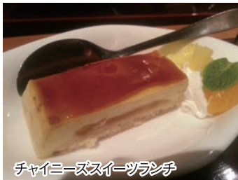
チャイニーズスイーツランチ