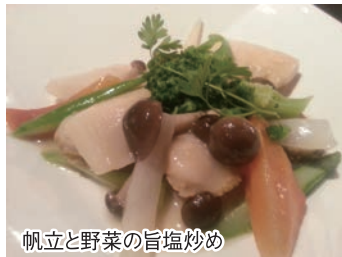
帆立と野菜の旨塩炒め