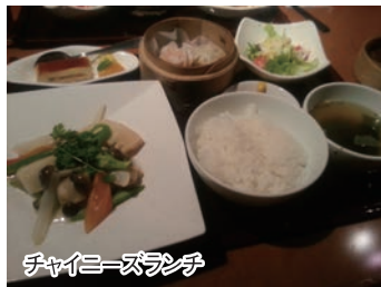
チャイニーズランチ