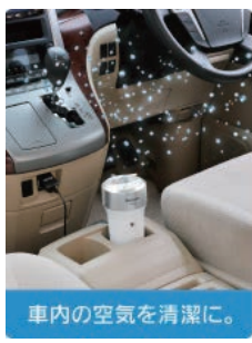
車内の空気を清潔に。