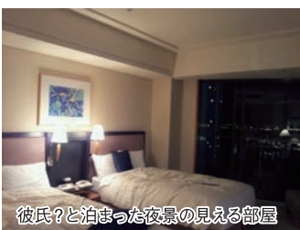
彼氏？と泊まった夜景の見える部屋