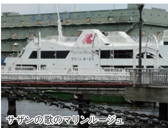
サザンの歌のマリンルージュ