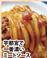
宇都宮で一番濃い ミーツース

住所: 宇都宮市下岡本町 4547-12 電話: 028-673-5081 営業時間: 11:00 ~ 21:30 (年中無休)