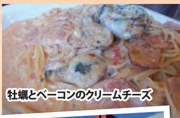
牡蠣とベーコンのクリームチーズ