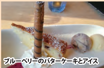
ブルーベリーのバターケーキとアイス