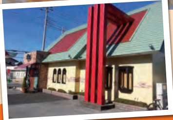
イタリアンダイニング すば屋

住所: 宇都宮市下岡本町 4547-12 電話: 028-673-5081 営業時間: 11:00 ~ 21:30 (年中無休)