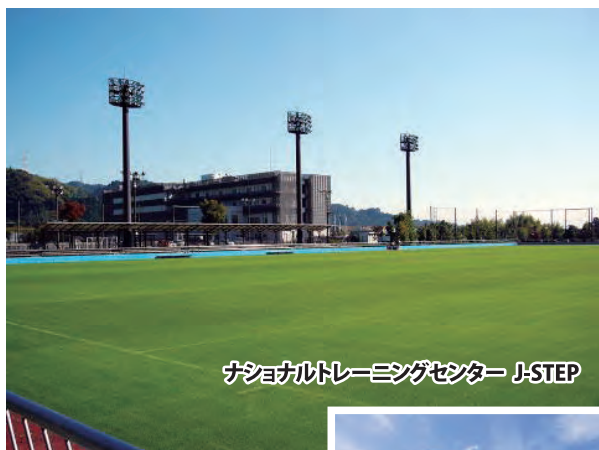
ナショナルトレーニングセンター J-STEP

1995年、バリ島帰りの日本人約200人がコレラに感染した。多くは「エルトルオガワ型」という比較的軽微なコレラだったが、不思議なことに日本人ばかりが感染したのである。 当時のバリ島ではコレラは流行しておらず、他の外国の旅行者も感染していた可能性はあるのだが、症状が極めて軽微なため気付かなかった人も多かったらしい。日本人は他国より衛生環境が良いため、その免疫力が弱いとも考えられる。熱帯地方ではつい冷たい飲み物を摂りがちで、ビールや冷たい飲み物を摂りすぎて胃酸が薄まると、コレラ菌は腸で増殖する機会を得て発症しやすくなるので要注意だ。