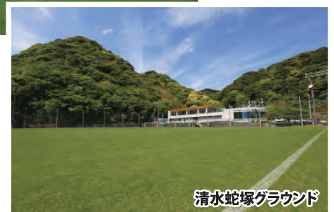
清水蛇塚グラウンド