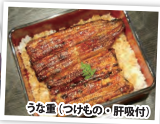
うな重(つけもの・肝吸付)

魚登久 住所: 日光市今市 467 電話: 0288-21-0131 予算: 3,000円 営業時間: 火~日 11:30 ~ 14:00 17:30 ~ 21:00