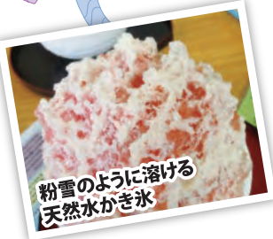
粉雪のように溶ける天然水かき氷

冬は北陸並みに気温が低く、雪が少ない日光は氷作りに適した地です。そんな日光には、天然水の生産を続ける店が3軒あり、そのうちの松月氷室では、天然水のかき氷が味わえます。これは、衝撃的な美味しさです!ふんわりとした舌触り、しかもそれも一瞬の出来事で口に入るとすんなり溶けてしまします。「シャリツ」だとか「サクザク」といった食感は無。ふわふわでしゅがありません!