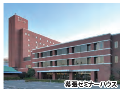
幕張セミナーハウス