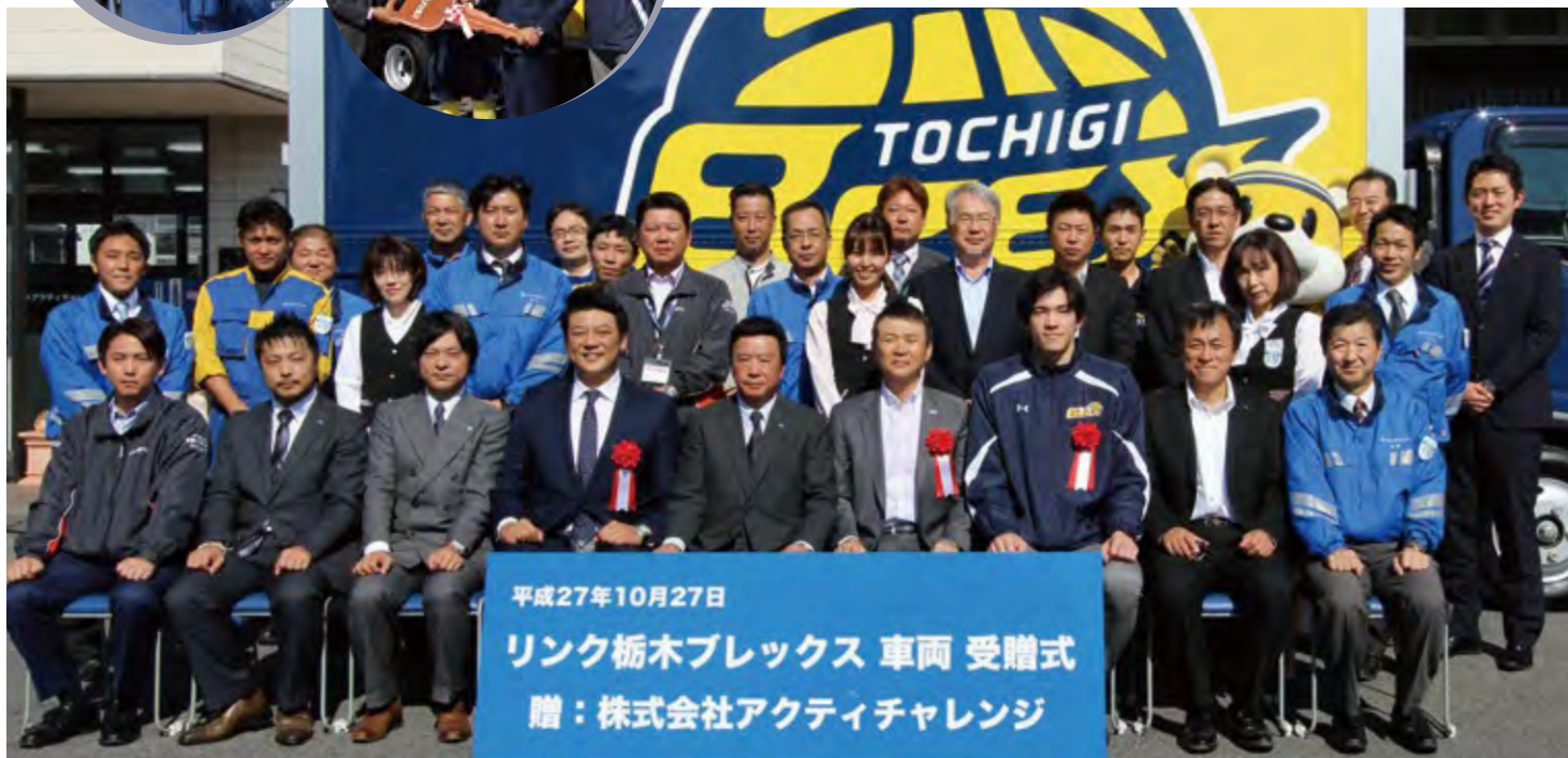
平成27年10月27日 リンク栃木フレックス 車両 受贈式 贈：株式会社アクティチャレンジ