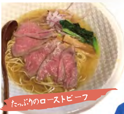
たっぷりのローストビーフ