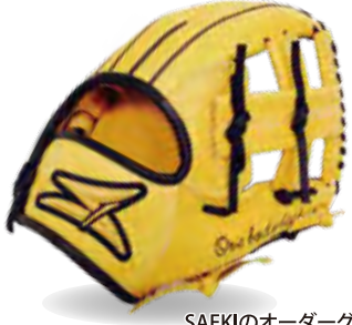
SAEKIのオーダーグローブ