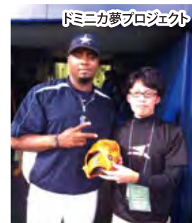
ドミニカ夢プロジェクト

じます。また栃木県内取り扱い代理店も募集中とのことです。興味がある方やご紹介いただける場合も併せてご連絡お待ちしております。