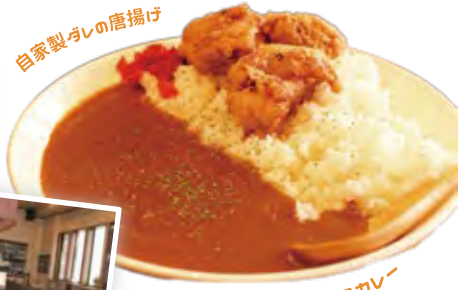
独自配合のスパイスカレー