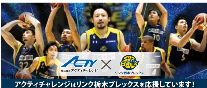
アクティチャレンジはリンク栃木ブレックスを応援しています!