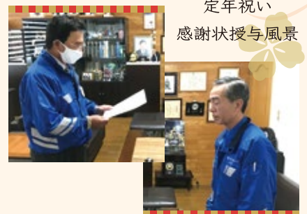
定年祝い 感謝状授与風景