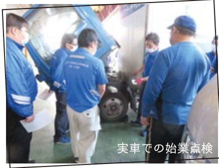
実車での始業点検